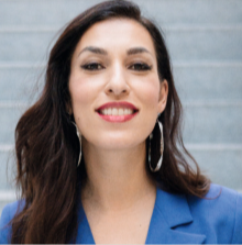
Tijen Onaran CEO, Global Digital Women GmbH