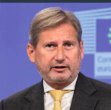
Dr. Johannes Hahn EU-Kommissar für Haushalt und Verwaltung (digital zugeschaltet)