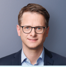
Dr. Carsten Linnemann MdB Generalsekretär der CDU Deutschlands