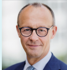
Friedrich Merz MdB Vorsitzender der CDU Deutschlands